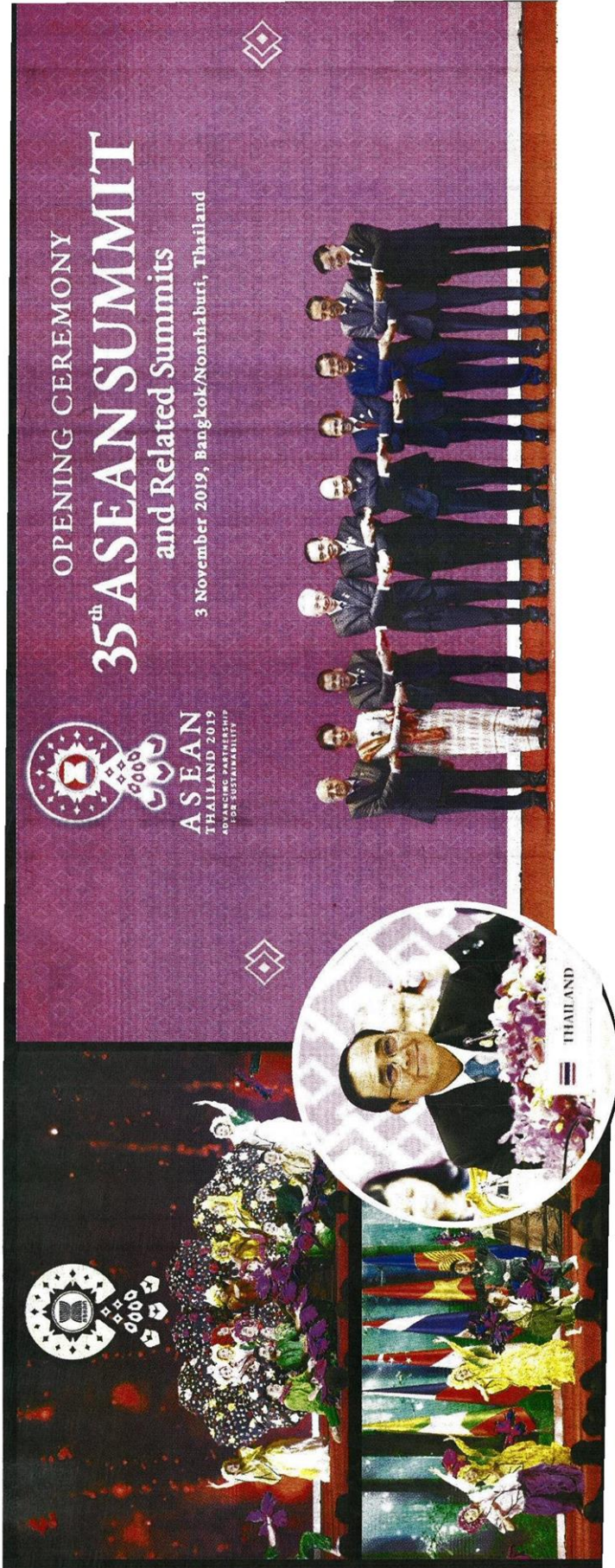
■ สุดยอดอาเซียน ■ พล.อ.ประยุทธ์ จันทร์โอชา นายกรัฐมนตรี จับมือถ่ายภาพผู้นำประเทศต่าง ๆ หลังเป็นประธานในพิธีเปิดการประชุมสุดยอดผู้นำอาเซียน ครั้งที่ 35 และการประชุมที่เกี่ยวข้อง ที่อมแฮ็ค เมืองทองธานี จ.นนทบุรี เมื่อวันที่ 3 พ.ย.